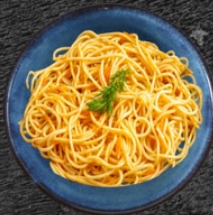
50. Fries Noodles 49 czk Smažené nudle noodles