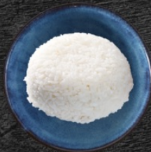
49. Jasmine Rice 49 czk Jasmínová rýže Jasmine rice