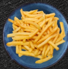
51. French fries 79 czk Hranolky French fries